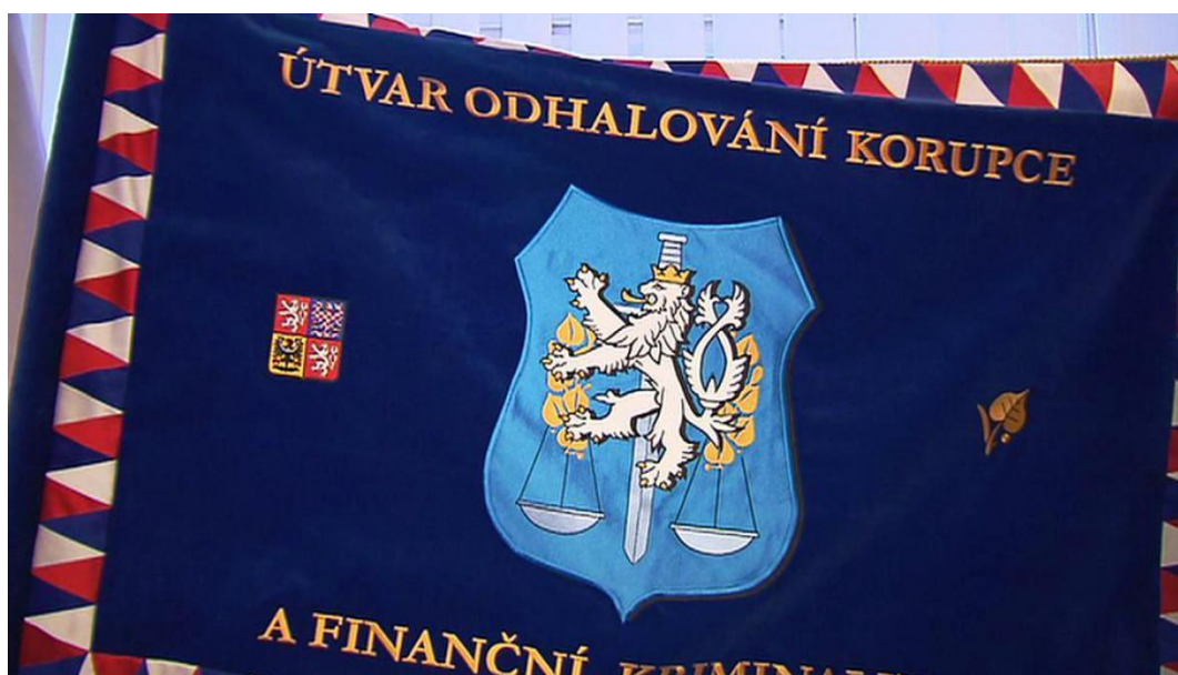
ÚOKFK – Standarta.